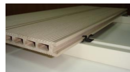
Рис. 3. Укладка доски на монтажную лагу