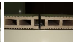
Рис. 4. Зазор между досками