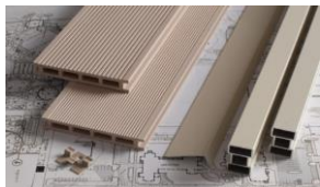
Рис.1 Элементы террасной системы ЭКОДЭК: террасная доска, кляймер, лага монтажная, L-профиль

Террасная система «ЭКОДЭК» представляет собой комплект, состоящий из следующих элементов: террасная доска, монтажная лага (алюминиевая или композитная), кляймер (крепежный элемент) и «L-профиль»/уголок для декорирования торцов/углов.